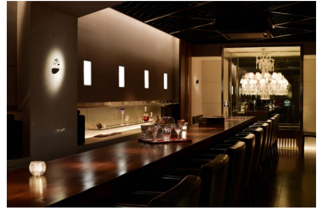
B bar Marunouchi 内観