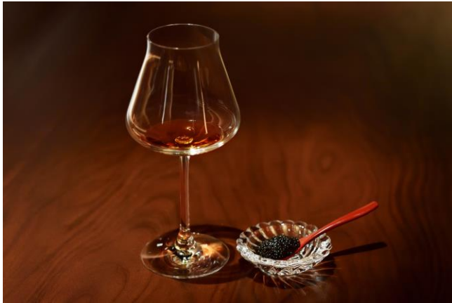
テイスティングセット

「シャトーバカラ」のグラスに注いだ10MLの「ルイ13世」と、B barセレクションのキャビアを1スプーン添えた究極のテイスティングセットです。「ルイ13世」「バカラ」「キャビア」という至高のマリアージュをお楽しみいただけます。